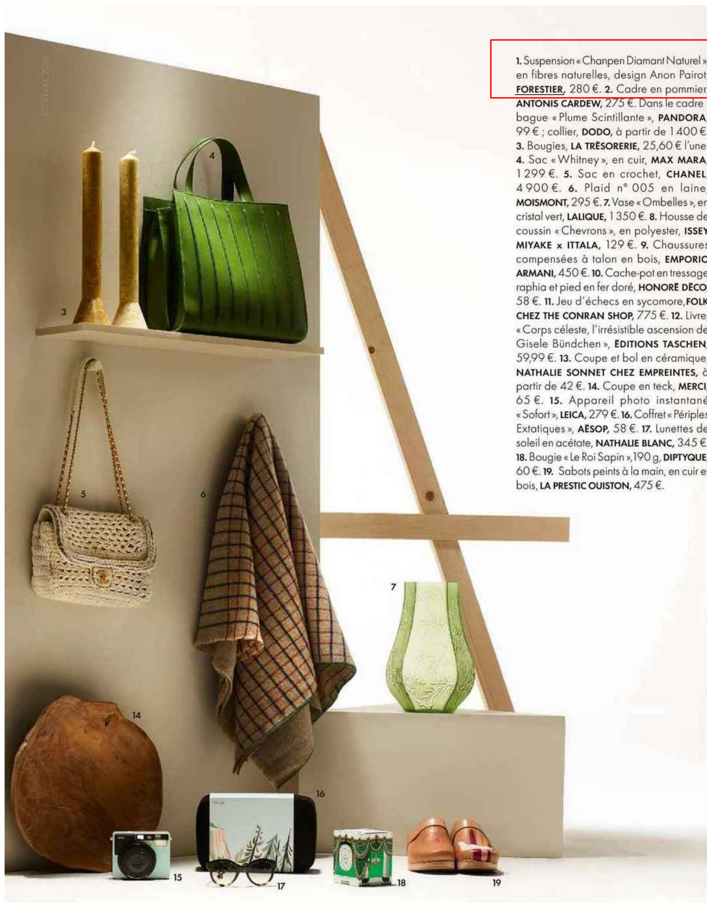
1. Suspension « Chanpen Diamant Naturel », en fibres naturelles, design Anon Pairo, FORESTIER , 280 €. 2. Cadre en pommier, ANTONIS CARDEW , 275 €. Dans le cadre :

bague « Plume Scintillante », PANDORA , 99 € ; collier, DODO , à partir de 1 400 €. 3. Bougies, LA TRÉSorerIE , 25,60 € l'une. 4. Sac « Whitney », en cuir, MAX MARA , 1 299 €. 5. Sac en crochet, CHANEL , 4 900 €. 6. Plaid n° 005 en laine, MOISMONT , 295 €. 7. Vase « Ombelles », en cristal vert, LALIQUE , 1 350 €. 8. Housse de coussin « Chevrons », en polyester, ISSEY MIYAKE x ITTALA , 129 €. 9. Chaussures compensées à talon en bois, EMPORIO ARMANI , 450 €. 10. Cache-pot en tressage raphia et pied en fer doré, HONORE DECO , 58 €. 11. Jeu d'échecs en sycamore, FOLK CHEZ THE CONRAN SHOP , 775 €. 12. Livre, « Corps céleste, l'irrésistible ascension de Gisele Bündchen », EDITIONS TASCHEN , 59,99 €. 13. Coupe et bol en céramique, NATHALIE SONNET CHEZ EMPREINTES , à partir de 42 €. 14. Coupe en teck, MERCI , 65 €. 15. Appareil photo instantané « Sofort », LEICA , 279 €. 16. Coffret « Périples Extatiques », AESOP , 58 €. 17. Lunettes de soleil en acétate, NATHALIE BLANC , 345 €. 18. Bougie « Le Roi Sapin », 190 g, DIPTYQUE , 60 €. 19. Sabots peints à la main, en cuir et bois, LA PRESTIC OUISTON , 475 €.